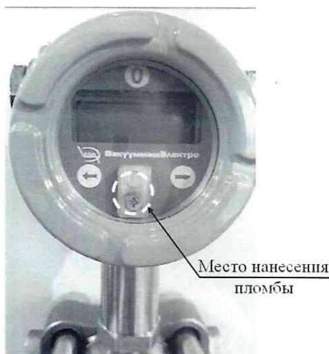
Рисунок 2 – Место нанесения пломбы